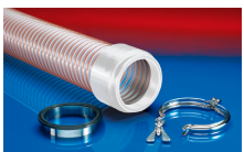
CONNECT 245 FOOD