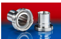
CONNECT DAIRY FITTING 247