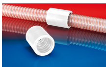
CONNECT 246 FOOD