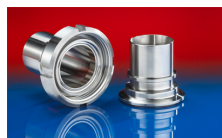
CONNECT ASEPTIC FITTING 249