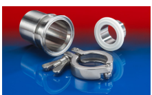
CONNECT TRI-CLAMP FITTING 245