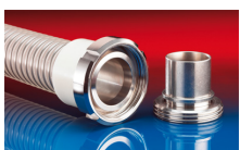
CONNECT MOULD ASSEMBLY 233