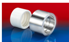
CONNECT PRESS ASSEMBLY 232