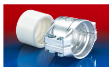
CONNECT SAFETY CLAMP ASSEMBLY 231