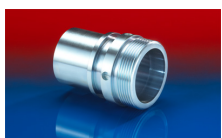
CONNECT THREAD FITTING 234