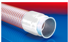
CONNECT 243 FOOD